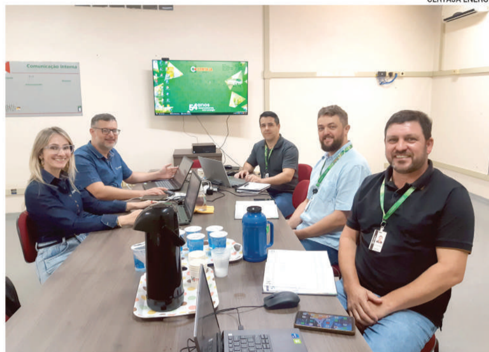
Leilão ocorreu de forma virtual, no dia 24 de janeiro, e contou com mais de 70 lances

A CERTAJA Energia promoveu leilão eletrônico para compra de energia elétrica. No lançamento do edital, a Cooperativa dividiu sua compra em dois produtos para Energia Convencional, com quantidades de energia e prazos distintos. Após a publicação do edital, 11 empresas vendedoras enviaram a documentação e foram habilitadas.