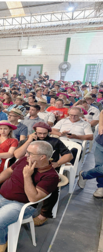
Público recorde prestigia AGO histórica