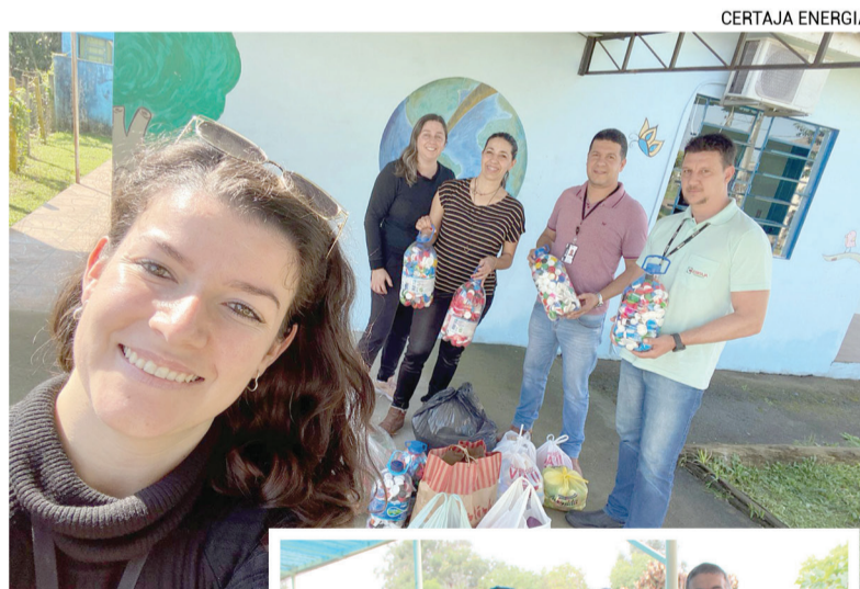
Associação Pequenos Notáveis e APAE Taquari foram beneficiadas com as doações

As instituições podem vender as tampinhas plásticas e utilizar o valor em prol das crianças atendidas e para a manutenção dos serviços. "O valor que é retornado às entidades não é tão alto, mas cada ajuda é bem-vinda para que elas consigam alcançar os objetivos que almejam com essas tampinhas", reforça Marina.