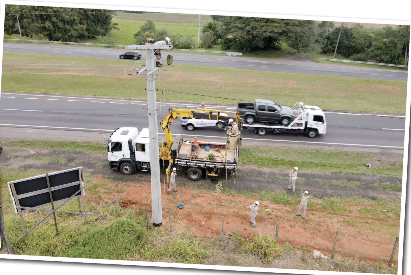
Obra na localidade de Catupi, em Triunfo, recebeu investimento de R$ 1,2 milhão e beneficiará mais de 500 cooperados