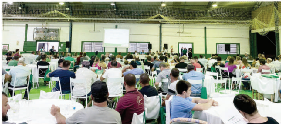
CERTAJA Desenvolvimento recebe grande número de associados para a assembleia 2024

Hoje, a Cooperativa conta com 139 colaboradores, entre gerentes, técnicos, veterinários, engenheiros, auxiliares administrativos e trabalhadores responsáveis pela manutenção e instalação de redes elétricas. Reconhecida por sua inserção no desenvolvimento socioeconômico das comunidades que atende, a CERTAJA Desenvolvimento tem na segurança do trabalho um dos quesitos fundamentais de