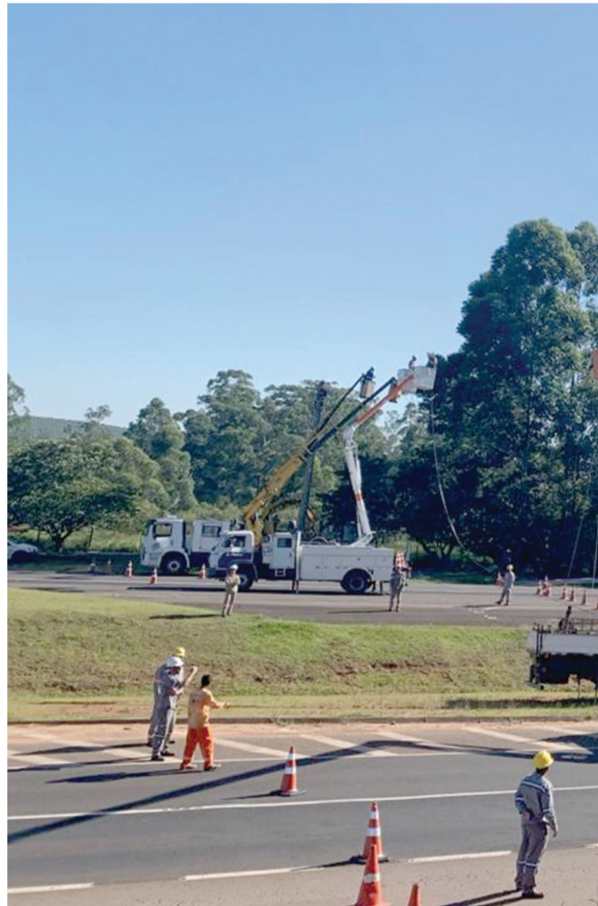
Obra realizada para atender a nova fábrica da Fruki e região recebeu investimento de R$ 2,8 milhões

"Também há um planejamento de investimentos na região de Barão do Triunfo, onde pretendemos conectar em uma nova subestação da CEEE/Equatorial, para melhorar o fornecimento", destaca.