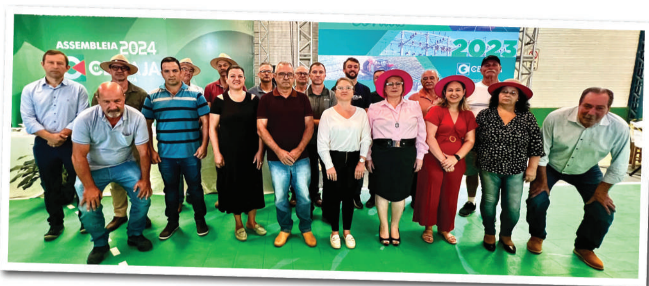
Conselhos de Administração e Fiscal eleitos